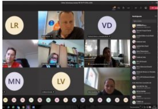
Časť informačných seminárov NP DI PTT prebiehala aj online formou.