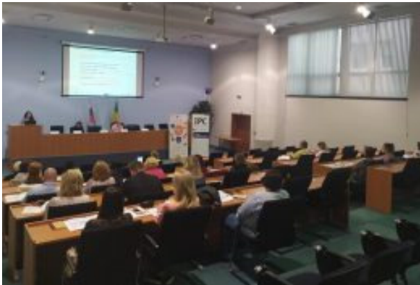
Informačný seminár v Žiline prebehol dňa 17.09.2020 v Informačno-poradenskom centre.

Implementačná agentúra Ministerstva práce, sociálnych vecí a rodiny Slovenskej republiky spustila koncom augusta možnosť predkladania žiadostí na zapojenie sa do národného projektu Deinštitucionalizácia zariadení sociálnych služieb – Podpora transformačných tímov (ďalej len „NP DI PTT,“). V tomto už 3. cykle mali šancu všetky zariadenia sociálnych služieb, ktoré neuspeli v predchádzajúcich cykloch alebo aj tie, ktoré sa v predchádzajúcich kolách nestihli prihlásiť.